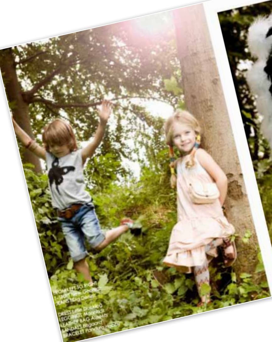
FROM LEFT TO RIGHT: SHIRT: Les Grands JEANS: Dig Denim DRESS: Little Dumbo LEGGINGS: Mado LEATHER BAG: Alpelt SANDALS: Bogaard BRACELET: Pandora Hobby