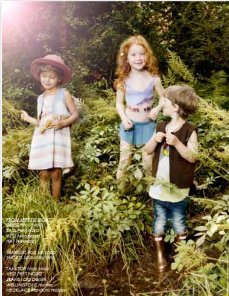
FROM LEFT TO RIGHT: DRESS: Nido Nido HAT: Petit Nord VEST: Mado HAT: Mado SWIMSUIT: Pop Up Shop SHOES: Mado TANKTOP: Nido Nido VEST: Petit Nord JEANS: Dig Denim WELLINGTONS: Hunter NECKLACE: Pandora Hobby