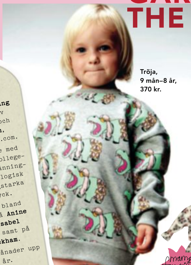
Tröja, 9 mån-8 år, 370 kr.