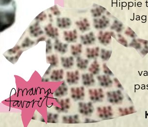
Klänning, stl 9 mån- 8 år, 260 kr.

Jag har många kunder på det södra halvklotet, och de har sommar under tiden vi har vinter, så jag ville tänka på dem också. Och varför ska man inte kunna ha pastellfärger under höst och vinter?