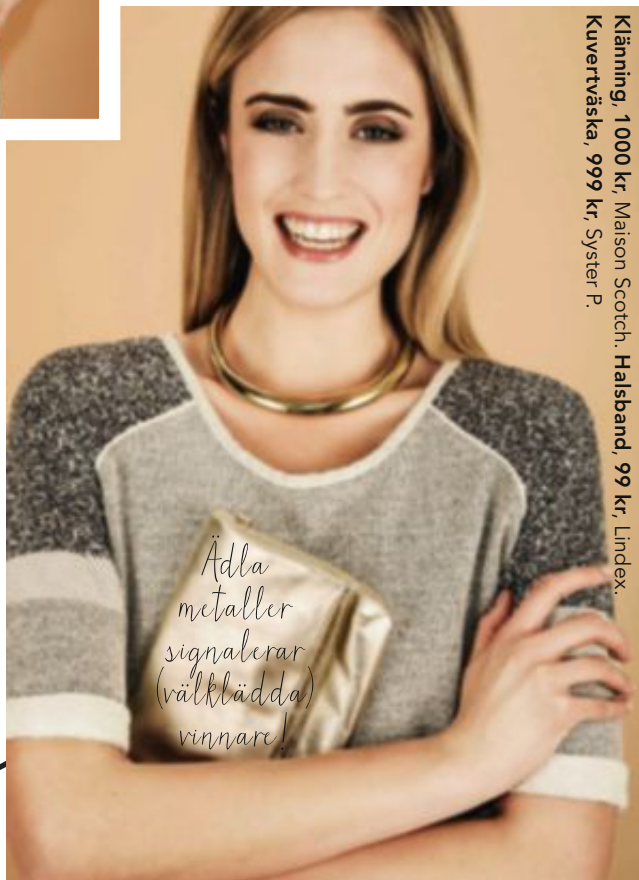
Klänning, 1 000 kr, Maison Scotch. Halsband, 99 kr, Lindex. Kuvertväska, 999 kr, Syster P.

Ädla metaller signalerar (välklädda) vinnare!