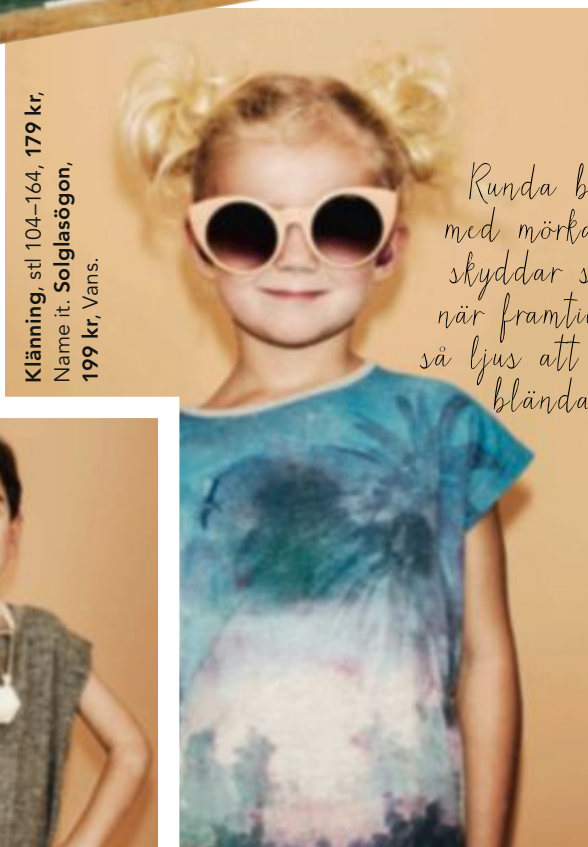
Klänning, stl 104-164, 179 kr, Name it. Solglasögon, 199 kr, Vans.

Runda bugar med mörka glas skyddar snyggt när framtiden är så ljus att du blir bländad!